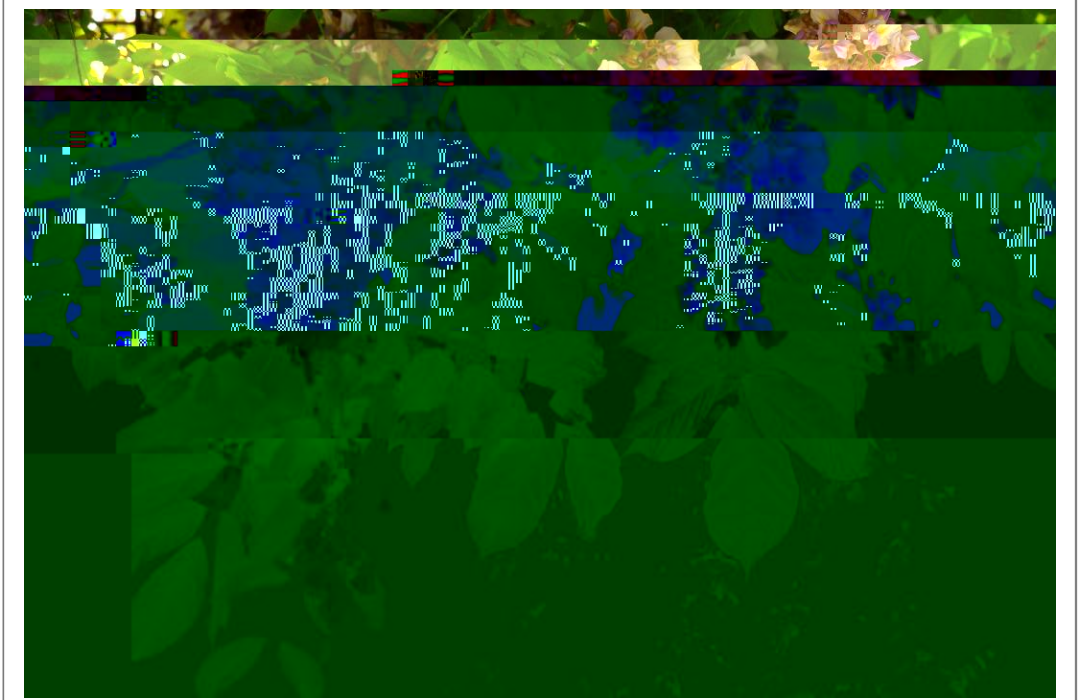
紫藤花开 露 \ 摄

| C斯W夜车 W) 者 Z 6 / U 6 f | 阅 -! 看 M 4 x } -W恐 体4=&x1k 6一些 薄 怖小 =N它 $} -C' ( 见 &4t 27去6> - 生哲@6{ %而 &更有7 些> 化{ kl 6-C =而 3+, = MP 它. &6三 那些> 塑y &46 生轨 观O生 - 6影响| X=也寄托 &46情 归m| | C斯W夜车 6{ 者} - &%DT C斯-e审 e叫帕斯·梅`耶6瑞T { v | 视k 67去=t 2那鸯 清Z 6 小 6" 公 C斯} 一 /U6瞬间f | } ~跑{ 受 个 十多岁6K. x /s= k 6c脏猛烈撞击f 膛=$} 一生7U循规蹈矩A枯燥| 味6 T-Z 67v 吵{ K夜躺+ 生/= P有>I 7 何-Q=也 床5辗 侧=抑` } K Aq P有 何社 | - = 7· l { 巨36c@#n 些> 钦菲/ 3, =rY- T女 I HR足P让& 受 ] 清Zf= =>她65T 2袋Ch现 一 种 R## } 情 6 Wc 葡萄牙x 写6) dtd| 波1 =$有 魂6B撼=>K 铭 炼 s | C斯A此) j c6| & $+t 2 e6G " K 6 吸>=% 抛Y并 =也+努U体4生/K 6 个 有序6生/ =>%探索c At G | 2生命E 极答 6~J | 有G 生$需8 么一个契 +帕斯·梅`耶6描 K= 机=p1也Z =Z 也罢=踏5一 | 炼 s -) p 孤 A 趟c 6 车=P一种5F 6视 亡=3 AG间: B| . 角看待k T l 6一切| &触1~36} Kp 6] 清