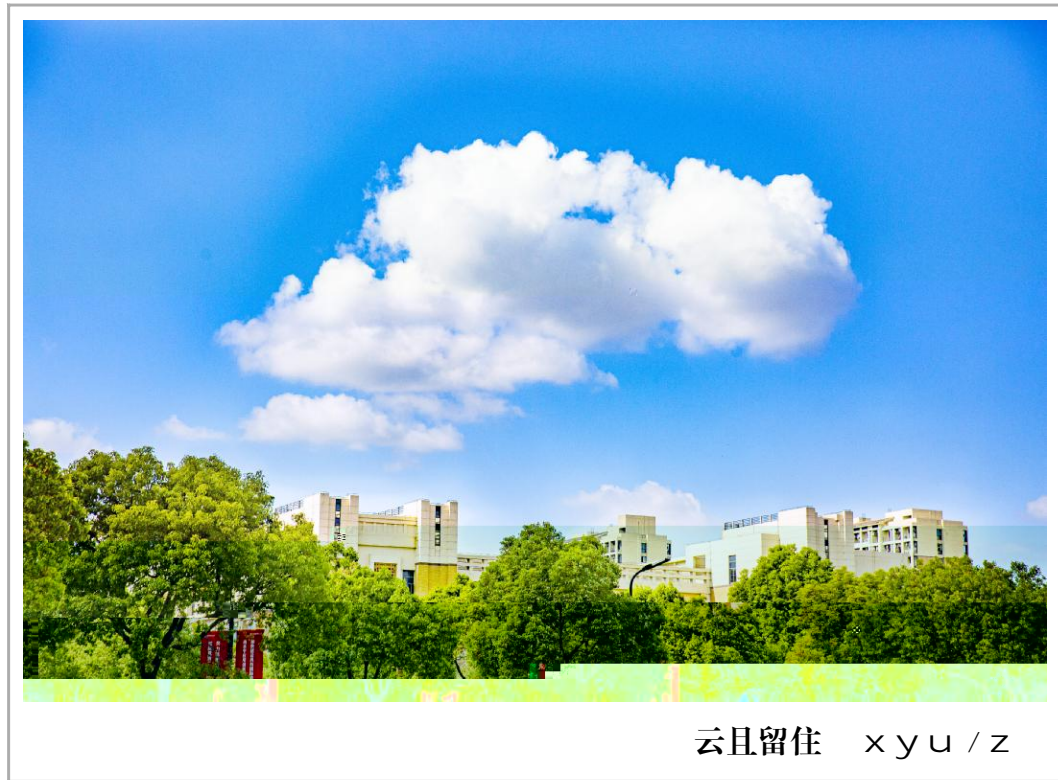
云且留住 xyu / z

n=} ~5 • 5 2020 2 4 像 < d 武汉武' ) 或救死 6 n=} ~5 坐 < 6旁 ) 刘 迹 像 兰娟) 1 1 伤 j 像 1 载 遗 辆 停 \ 捐D q e q物 眼泪瞬- 像A 堤 H 洪 眼朦胧 : ; 眼泪 白: k Pd N ( O k | 角 = 汗 z b 或 k z g 灯火 " 7 像# 宏 k t 奉; j 像 1 q j k k 奶奶 捡 - k q p警 叔叔 . + 戴6罩 d M j (i ? P 该 ? (i ? E r >? 首h 懂 ~ 或 -- 像钟南 ) k戴 j 像 w ~ ~ 悬 6 " o , z V 筑 S e 朋友圈 j + 朋友 宝 ~ % : e k 珍惜 病L 渡 油w