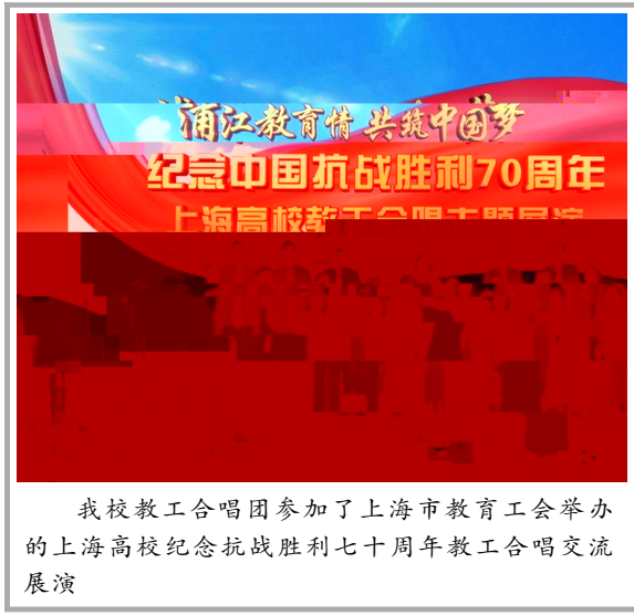
我校教工合唱团参加了上海市教育工会举办的上海高校纪念抗战胜利七十周年教工合唱交流展演

, 悦牵/ e 益l m 5 从2014 + hi 与空r 小% q 帮 $ 每+ 儿童 < * 会hu 圆 = 动$ 至c 成功 帮助150 名贫 儿童圆 gp 们还 t + + 为v 小% P 立u _ l 籍阅览角g 悦牵/ 的志h 者们( ) p * 动 为3V > 的z j 尽绵 & i $ 同/ + ) 我&大%` 4 于助5 $ q 爱p 5 的精. 发 ; 大g