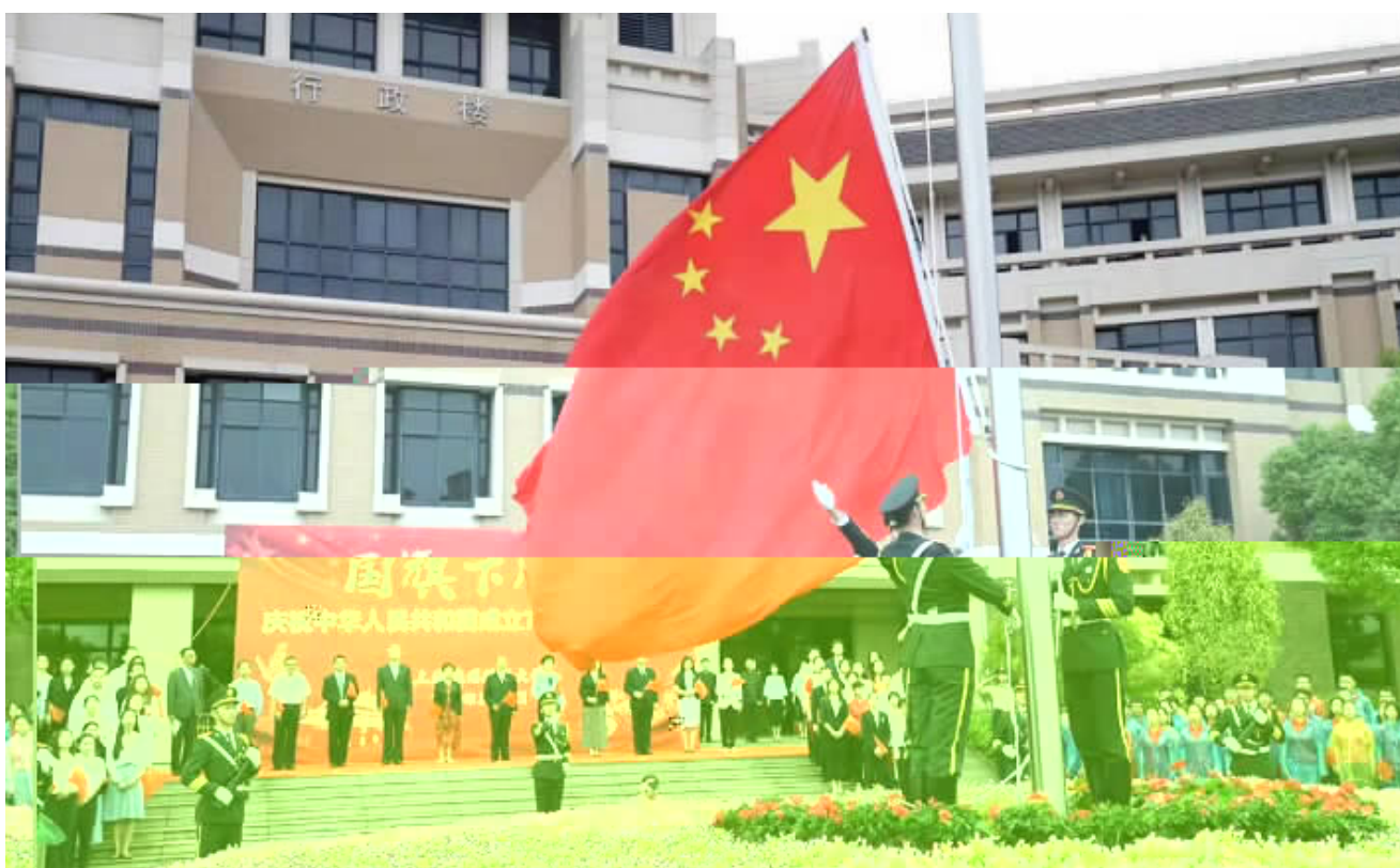
本报讯 通讯员 周雄才 70