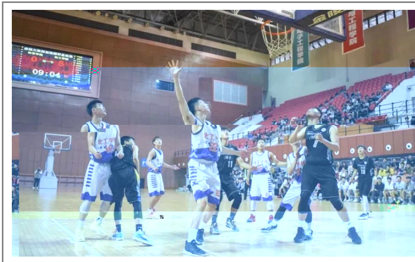
5月20日晚，作为我校传统体育赛事之一的“校园杯”篮球赛圆满落幕。经过激烈角逐，化工学院夺得本届篮球赛冠军，经管学院获亚军，城建学院和工创学院分获三、四名。(体教部供稿)

近日，上海市人力资源和社会保障局公布了2021年度上海市基础研究项目基地，我校教授参与的“怒州乡村振兴项目”获国家“2021年度乡村振兴项目”(上海市获2个项目)，这是我校获国家项目。我校LED香料香技术植物半照及技术研究中国及妆品中国 萱草种库，学研度合沪滇生合，国脱贫攻坚美丽中国建了“怒州乡村振兴项目”将一技术，由我校半照团的LED照技术最度突照足缺，据植物定波的人补照，稳生目的一种多学科叉生技术的，民脱贫，扶贫(人事处供稿)