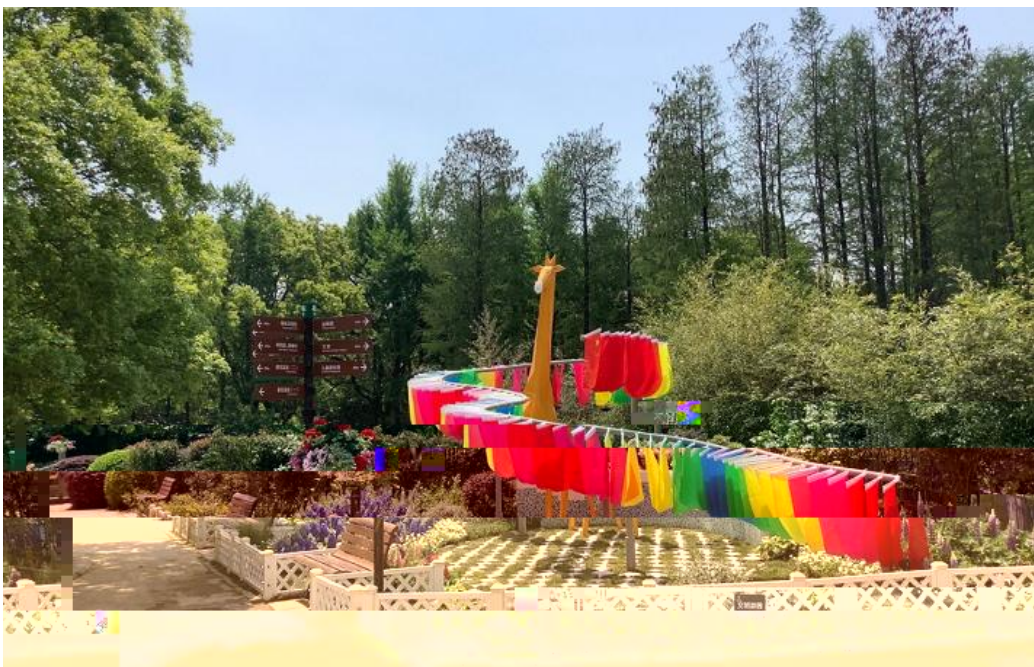
2020 般凌跃而 绕 而 多 共存是 陆丝绸之 望 缩影 寓意是 连世界 筑繁 同时 为了响应抗击疫情 号召高高 颈 还戴 了手 缝制 口罩

时代新 M7青年担XOP J QI 控 击 9青春力量M 各34党政 =人"各职c w处 =人也 网络*线团员青年Q . 五i tu与青年成长" J QI 控与青年担X等OP团员青年讲1主题 团3O发团员青年 国主J O怀O增强新时代青年团员7历 使命和=任感M&导师"Q 党员"Q 3生也参与h本=主题: 团日DO充分发? `模范引领作K O与团员青年线c DOK新4K OK新行m助力 JOK 7 "7心和7 人生发7 M