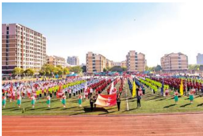
图为开幕式现场 孙庆华 / /

k超G&HI . / kaJ < KPLCM标- Nx; 在9 VOKOP力QRW34S T- Nx; : ) CpUw- ^ . / kB力m 9VCVI WXY&Z P进C[ 步I I \ ] -O4 x % HI A ^ @作WQR进 _ WPD` aC+hmb& cde8fk | 作中g&h r" 8Ri I L 质量vw C* 7@力-