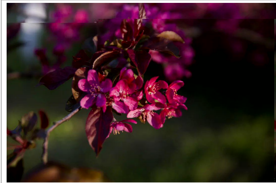
春光里 t u 华 v

但我RMX授k 我国~ 的搭r Q署, 授k 常美L u m 我们H[ 的大 终I (胜 病M, 授k 我们人民R ]做好 党的后' ; !春有 开日," 有] N时, 授k 我们终] 在 uO( 落PQS的日X 重RS