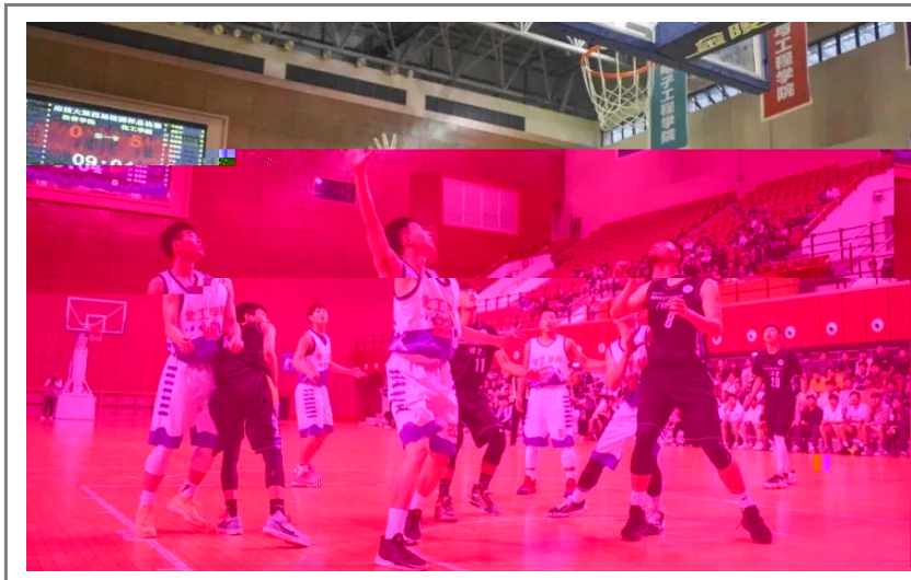
5月20日晚，作为我校传统体育赛事之一的“校园杯”篮球赛圆满落幕。经过激烈角逐，化工学院夺得本届篮球赛冠军，经管学院获亚军，城建学院和工创学院分获三、四名。（体教部供稿）

该项目由上海市人力资源和社会保障局、上海市乡村振兴项目领导小组、上海市乡村振兴项目专家服务团共同组织实施。项目旨在服务乡村振兴，由我校半日照技术X、LED技术Y、LED技术Z、LED技术C、LED技术M、LED技术F、LED技术P、LED技术K、LED技术4、LED技术R、LED技术C、LED技术T、LED技术A、LED技术R、LED技术M、LED技术H、LED技术7组成。