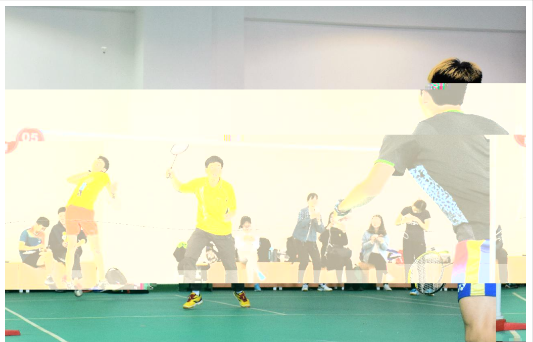
4 8 2017