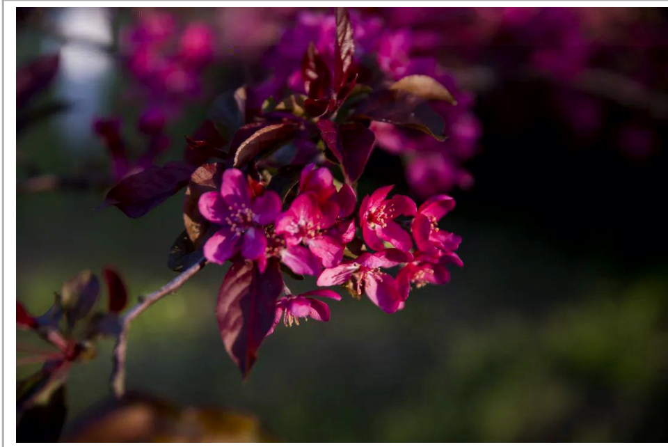
春光里 t U 华 V

日发生的_!我`2在学 校中听师畅,<M人s逐< 的生活,R`2在^; 的春天可以按楼K的. C,可以Aa的e,' 2可以按抚Y的7 ! 但我RM室k我国~ 的台Q排,室k态美u mttt我们H[的大终!胜 病,室k我们人民Rj]做好 党的后';!春有a开日,有] 时,室k我们终]在` (落 S的日Xb重