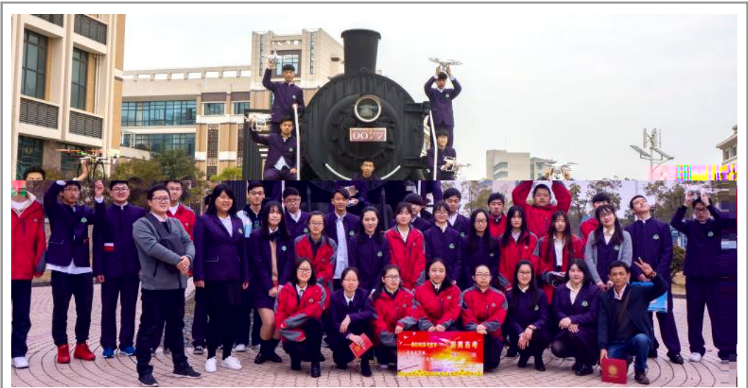
3 10 2017 三 生成 仪式暨 考百 冲刺动员 奉贤 区举行 图为 生 火车头广场前合影

环保节r 4! aX践场所] ! D与闵%中! <%de 沟 通交流&M成合6C向&即提供特 色专 a! 术! t" &协# #展 - $%结&O计N' J( ` "a( m) 克*, ! +, 目&PV导 其研究- ! f 课U. Q]