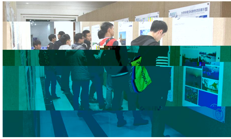
U V 的 q r s t 建设成果 200 余 . 展 板 , 集 中 呈 现 了 沪 上 20 所 高 校 j 具 r s t u v w x 展 y n t z f { | } 大 ~ 展 出 , h i j k l k , k k 与 m n o < p 的 i 大 学 q

!" (通讯员 姜伟杰) 11 11 ^ H ) J 3 ) J v 心 h 1 k f v 心 h ` a 对 n K 师 ( [ m f v 心 h p N 两 大 \ ] m \ ) J J H ^ 本 3 帮 _ 21 ( 大 J 项 目 H ) J J ) R ` 社 / m 社 / a H 举 / f b h c 之 果 d N e 战 f g 项 目 N h 大 J ) 计 大 ` 队 _ h a [ 大 型 H i @ 本 之 3 互 互 H 本 Z e m \ ] f 项 目 3 j k l / H J m n o p f h o P 3 精 H 对 项 目 d 大 q H 帮 u 8 利 ( m f v 心 h 3 x r 解 场 S s t 3 问 题 H u o p O 师 v w 3 M R ` 3 J Q m f v 心 h 3 p S V ) J J 3 m