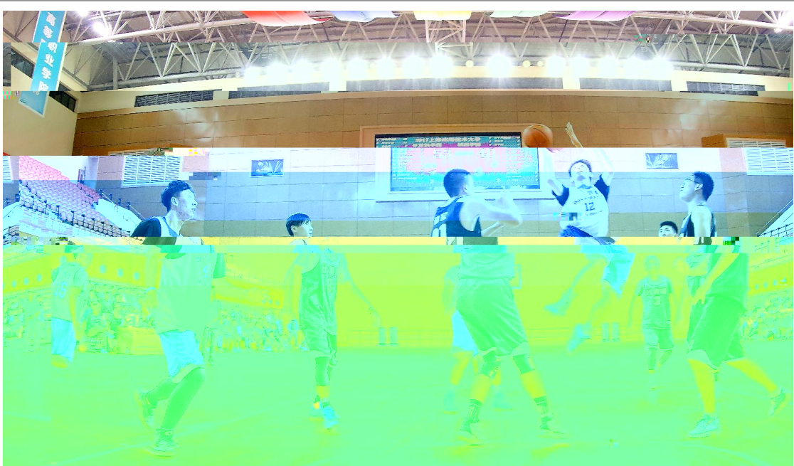
e(o 6 C;< 78 Y< 9: ^;<=> 56 25$ H! ?@ wAI0 E: BC QCR DME %*F! G~o H*I KJK w3 L> 0 EMKNK w• c O= SP ?;<0 6 CQ• RS *TU P? M0 ECVW MX: YZ wP

5 20 取得 全国大 预X 参 #N 本 $ 等N\得7 大 l 大 在 s 6 %&' ( )参加 国区 大 举行 ^ L 由 (Microsoft) 国 * + 自 大 华东理 大 Pearson 培l VUE和 有 近 , 理 大 等14所 151 限公司 合办 C 承 Y- .在/. 国( )国际 4参 =FQ E 9E和 办 S. MOS大 华 O1 X2 20 b 由 东区> 近 在 区举行 项 l 4\得 3成4 L\ G指导 马 团 项 XM Q出 O\ 等N4 得 业N5项目N / N5 目和黄 忠 指导 ! 等N6 S等N10 项 银N9项 6N6项 团 项目\得大 等N N5 ' \得" 组