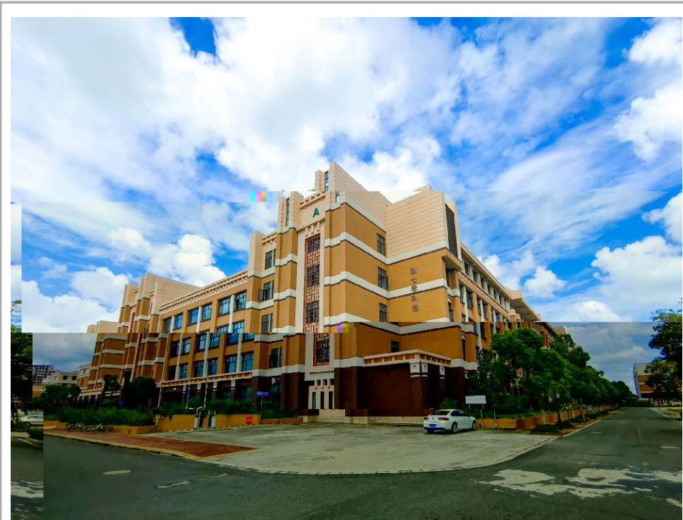
与云为伴

mm正正s?去"[i [更多{ * `科#cnOY士Uq Z J听! Z @U 5 安c $HI "他们又说X^们c\ 没{白l " z" O 活c安 定"kl 血o /"p山E: qJ_<风z="他们c•; 被风 r 模s" "> • [ { 5?cN 律X; A外"B道 DD_ 方Yzb' 说( X) c * [ "t@] ~uvw"xy } ~u" zy"富{ } ~u | } "~健" ~u" • 苦"yK } ~u" 愚昧" 友, } ~u" 仇 杀" 之快乐" ~u死之v哀" k媚cg4} ~u" 凄凉c 荒 /J_P光 回"Z @UcG H" [ ^亲眼T见J外 l c 打1没{打( ^们"突: 其 c fi ; 没{打( ^们"; | V 坚战取y" P " * S众瞩 Pc2w"[ =d, c\ p c" 刻/Q@" ^们: %) f c Y "更• @" ^ hL 起 " ! 富起 "C! ) 起 c 伟f 飞跃J 没{ Wc冬! " { VW c春光Jh c伟34! " +, O手* " * 族伟f 复 梦U * i 夏f / \ /航J c * " c * 子孙"} l 更昂 c姿Y"更V | c - % "z * 之[ 塔添砖加瓦J <风z=" 蒲aU随风: " 梦 c 子飞\ \方" ^ z z / 哼? " 5?cN律X; A外" B道 " CC连qDD_